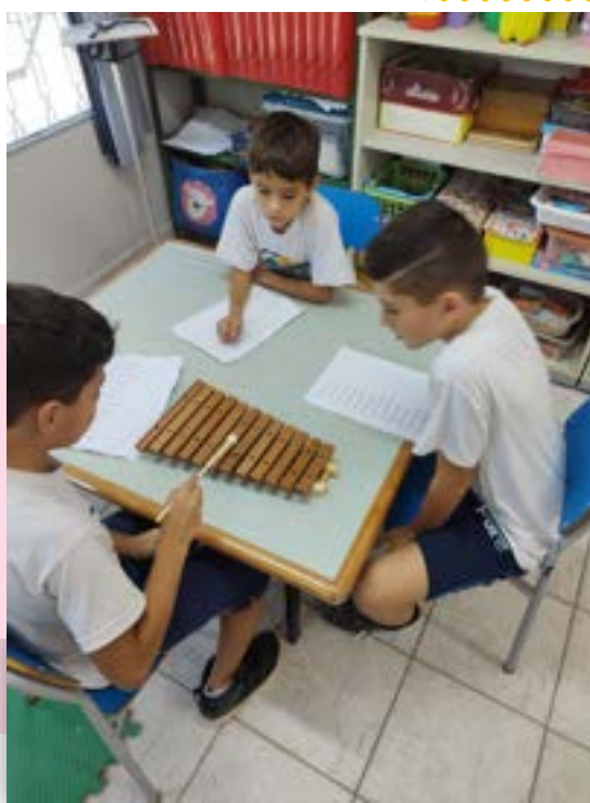
Aulas STEAM e Música