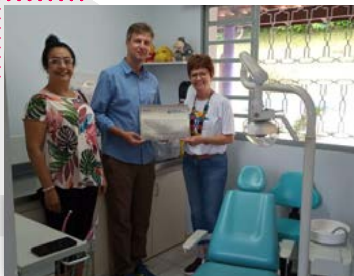
Reforma consultório odontológico