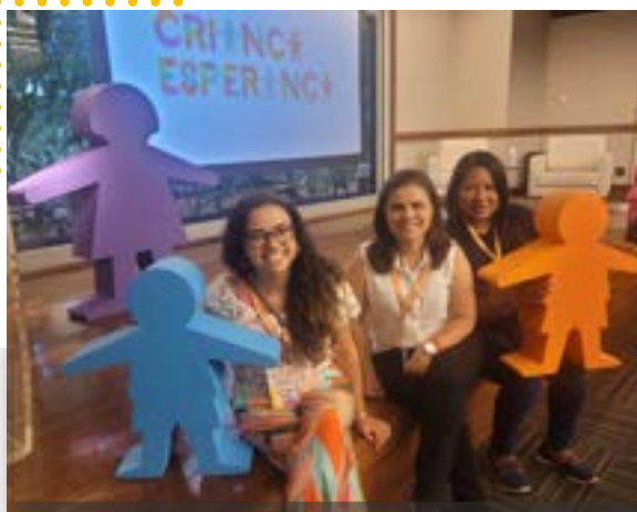
Evento Conexão Esperança (75 OSCs contempladas pelo Programa Criança Esperança)